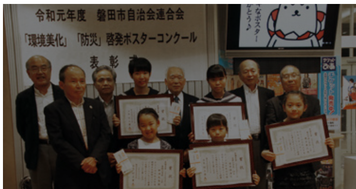
▲ 令和元年10月17日表彰式の様子（最優秀賞受賞者）

「環境美化」と「防災」啓発ポスターコンクールを実施しました。この事業は、こどもたちに地域に関心を持ってもらうとともに、自治会連合会の活動を周知するため、平成18年度からテーマを変えて実施しています。