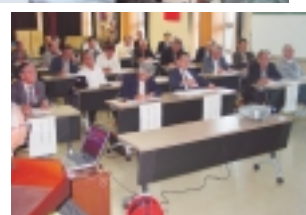
関心の非常に高い防犯