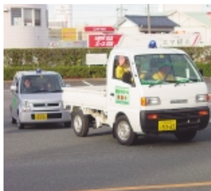
青色回転灯パトロール出発式

青色回転灯防犯パトロール 青色回転灯をつけた自動車で防犯パトロールが実施されています。