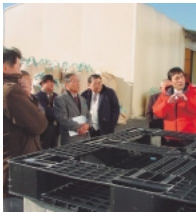
熱心に話を聞いて勉強

12月5日に、掛川市・菊川市衛生施設組合環境資源ギャラリーなどを見学しゴミの処理などについて学びました。