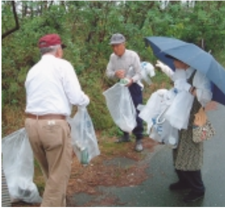
たくさんごみがとれました