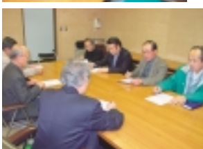
編集委員会の様子