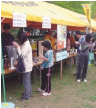
たくさんのお客さんで賑わいました

11月6日、安全防火フェアに参加し、防犯グッズの展示啓発や、おしるこの配布を行いました。