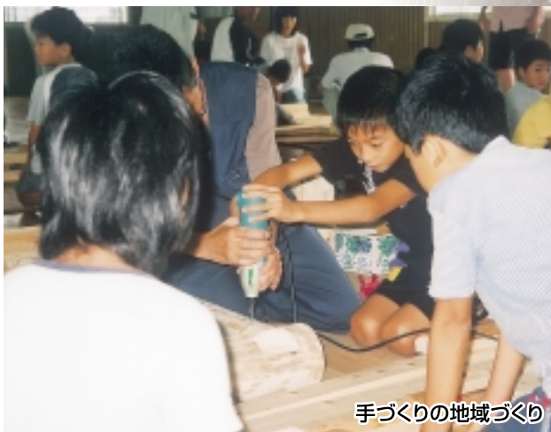
手づくりの地域づくり