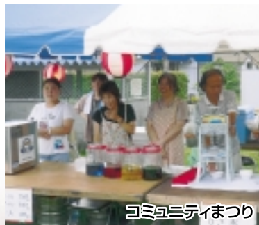
コミュニティまつり